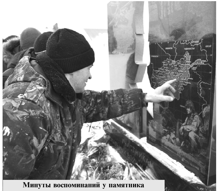
Минуты воспоминаний у памятника