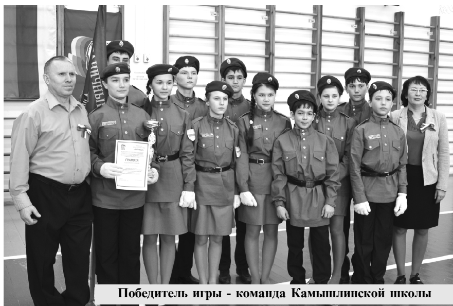
Победитель игры - команда Камышлинской школы

Среди команд учащихся 5-9 классов уверенную победу одержала команда Камышлинской школы. Призовые места заняли команды Новоусмановской и Староермаковской школ. Все команды-участницы получили дипломы и сладкие призы от местного отделения ВПП «ЕДИ-