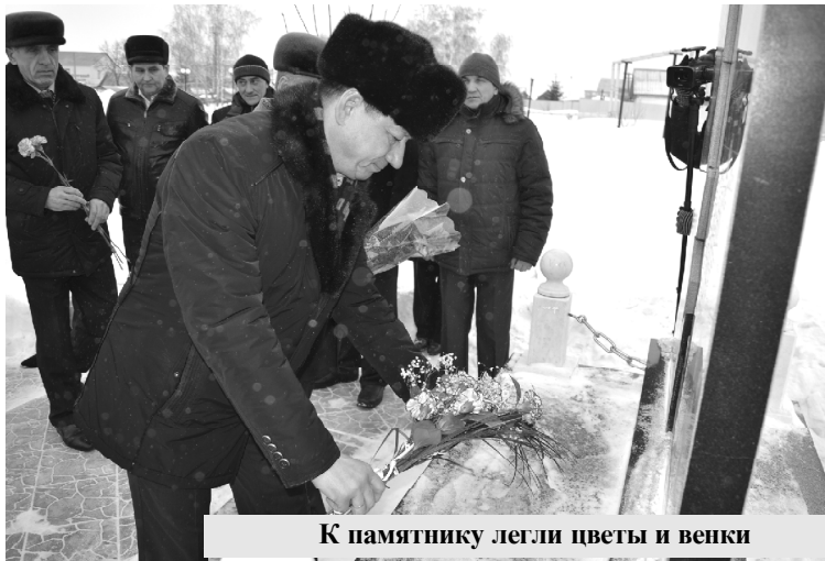
К памятнику легли цветы и венки