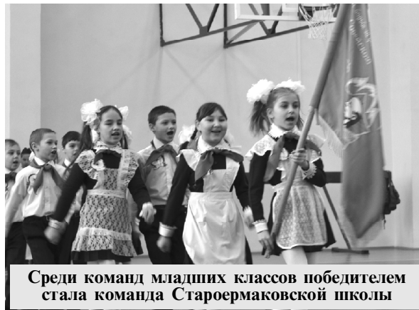
Среди команд младших классов победителем стала команда Староермаковской школы

туальная викторина на военную тематику, полоса препятствий. И это далеко не полный перечень заданий, который предстояло выполнить участникам. На каждом этапе команды зарабатывали баллы, показывая неординарные знания и оригинальность. Игра получилась захватываю-