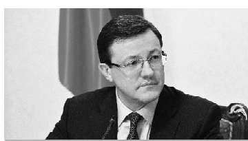
ДМИТРИЙ АЗАРОВ , губернатор Самарской области: