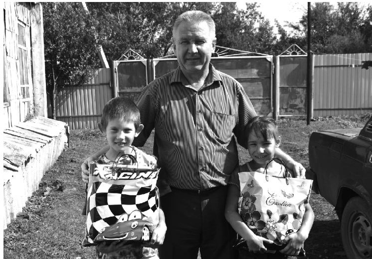
Благотворительная акция «Соберем ребенка в школу» станет для этих детей лучиком надежды на светлое и счастливое будущее.