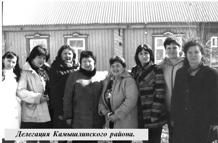
Делегация Камышлинского района.