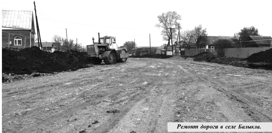
Ремонт дороги в селе Балыкла.