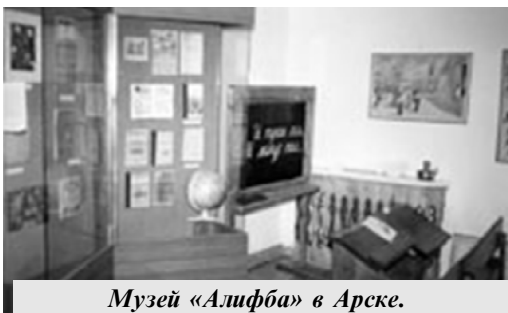
Музей «Алифба» в Арске.