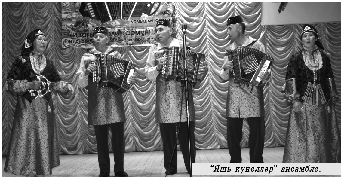
"Яшь күңелләр" ансамбле.

Исәнмесез хөрмәтле кунаклар, авылдашлар, моң сөюче дуслар! Бүген безнең Ка-