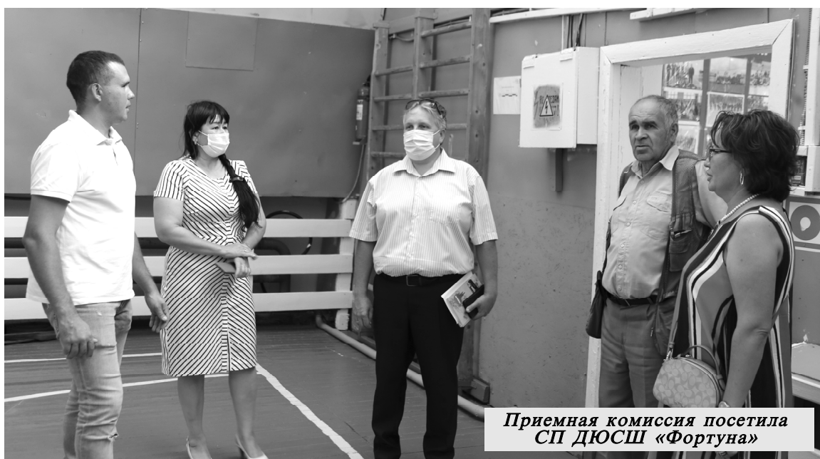
Приемная комиссия посетила СП ДЮСШ «Фортуна»

Уже середина августа, совсем скоро начало нового учебного года. Кто-то из родителей, чьи дети пойдут в школу, полностью подготовились к 1 сентября: закупили формы, учебные принадлежности, портфели, а кто-то еще продолжает этот марафон. Благо, государственная материальная поддержка детям в размере 10 тысяч рублей пришлось очень кстати. И мне, как родителю школьника, оказалось, так приятно ее получить. Но с приближением начала учебного года многих родителей больше всего волнует, как будут учиться дети с 1 сентября, сядут ли они за парту, не помешает ли коронавирус начать учебный процесс в очном режиме. Ведь тем, кто идет в этом году в первый класс, это очень трогательный и важный момент в их жизни, и хотелось бы, чтобы такое событие осталось в памяти ярким, светлым праздником.