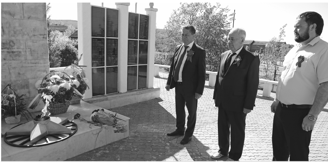
Торжественное возложение цветов к памятнику павшим в годы ВОВ.

В КАМЫШЛИНСКОМ РАЙОНЕ ПОДДЕРЖАЛИ РОССИЙСКИЕ ДИСТАНЦИОННЫЕ АКЦИИ, ПОСВЯЩЕННЫЕ ДНЮ ПОБЕДЫ