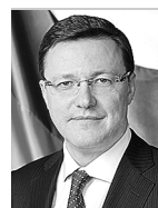
ДМИТРИЙ АЗАРОВ, губернатор Самарской области: