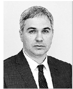
ДМИТРИЙ БОГДАНОВ, министр экономического развития и инвестиций Самарской области:

«Налог на самозанятых действительно себя хорошо зарекомендовал, - сказал Владимир Путин 26 марта на встрече с представителями предпринимательского сообщества. - Люди пользуются этим все