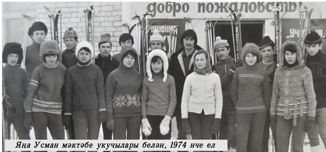
Яңа Усман мәктәбе укучылары белән, 1974 нче ел