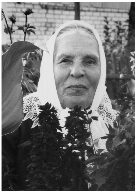
"Гөлбакчам бит бигрәк матур..."