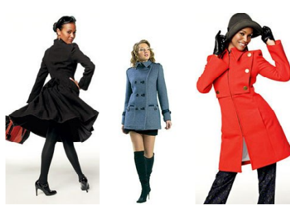
Реклама. ИНН 63110144548

СЕНО, СОЛОМА В ТЮКАХ, ТЕЛЯТА. ДОСТАВКА. Тел. 8-960-396-77-71, 8-927-636-09-12.