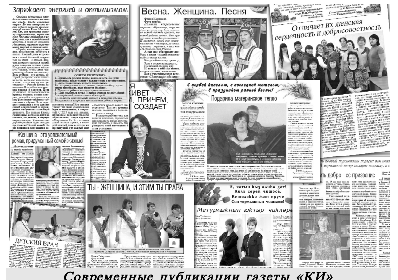
Современные публикации газеты «КИ»