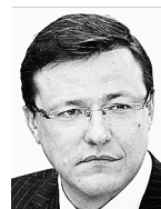
ДМИТРИЙ АЗАРОВ, губернатор Самарской области:

Сейчас в Самарской области в сфере ГЧП введен принцип проектного управления. Осуществляется индивидуальное сопровождение проектов "от идеи до ввода в эксплуатацию". Накопленный опыт и компетенции позволили региону приступить в прошлом году к реализации крупнейших инфраструктурных проектов федерального значения. Это строительство новой международной трассы с мостовым переходом через Волгу в составе международного транспортного маршрута Европа - Западный Китай. Напомним, сейчас на правом берегу реки уже развернуты работы по устройству бу-