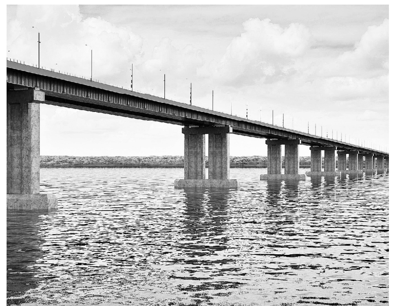
ПРОЕКТ СТРОИТЕЛЬСТВА МОСТОВОГО ПЕРЕХОДА ЧЕРЕЗ РЕКУ ВОЛГУ ВОЗЛЕ СЕЛА КЛИМОВКА В РАМКАХ КОНЦЕССИОННОГО СОГЛАШЕНИЯ ВКЛЮЧЕН В СТРАТЕГИЮ ПРОСТРАНСТВЕННОГО РАЗВИТИЯ РОССИИ

ронабивных свай и сооружению причальной стенки для подвоза грузов, началась установка первой береговой опоры. Также важным вкладом в развитие инвестиционного потенциала губернии станет строительство железнодорожной ветки для обеспечения деятельности Особой экономической зоны "Тольятти" в рамках концессионного соглашения с ОАО "Российские железные дороги". Не менее значимый проект, реализуемый также совместно с РЖД, - ускоренное пассажирское железнодорожное сообщение Новокуйбышевск - Самара - аэропорт Курумоч - Тольятти.