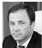
ИГОРЬ КОМАРОВ, полномочный представитель Президента РФ в ПФО:

- Я приятно удивлен качеством проработки проекта "Внутри истории". Хотелось бы, чтобы эту тему не бросали и развивали дальше. Есть определенная уникальность в том, что этот проект поднимает такую важную историческую тематику. Дается очень интересная информация и необычный подход в ее подаче.