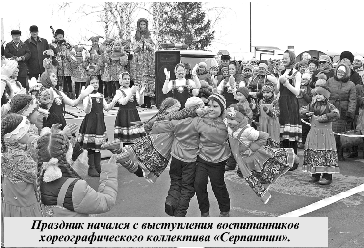
Праздник начался с выступления воспитанников хореографического коллектива «Серпантин».