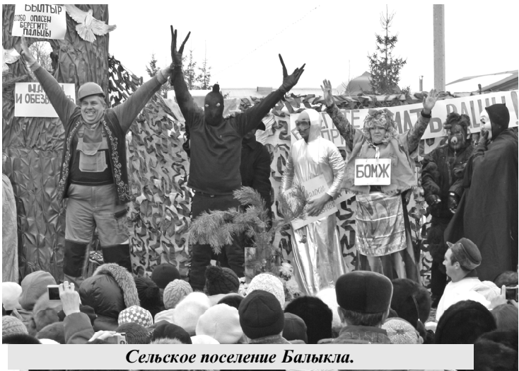
Сельское поселение Балыкля.

8 марта в Камышле прошло весело и необычайно шумно. Задорная музыка притягивала все больше народа на центральную площадь села. Разве возможно усидеть дома, когда весь народ провожает Зиму и встречает Весну.