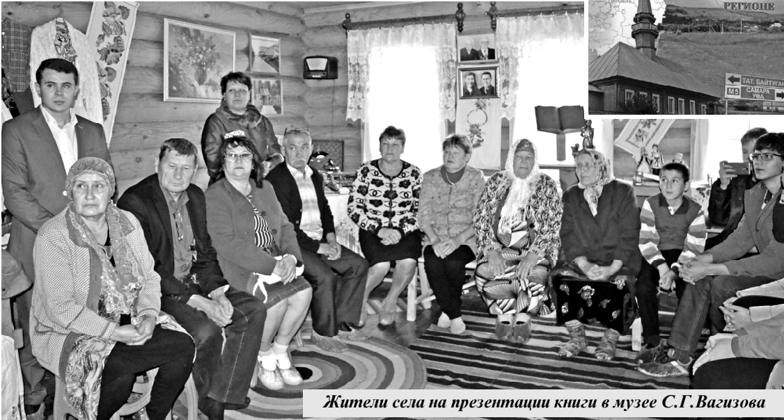
Жители села на презентации книги в музее С.Г.Вагизова

В БАЙТУГАНЕ СОСТОЯЛАСЬ ПРЕЗЕНТАЦИЯ КНИГИ «ИСТОРИЯ ТАТАР В КАМЫШЛИНСКОМ РЕГИОНЕ»