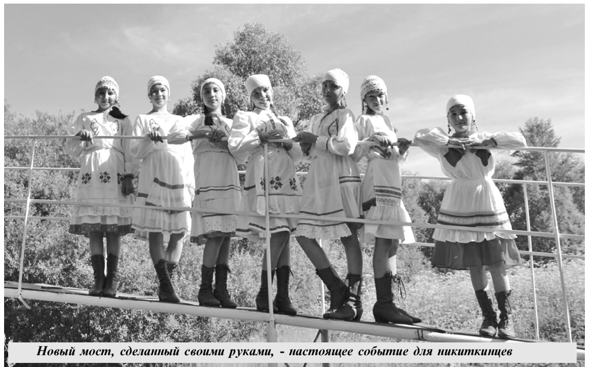
Новый мост, сделанный своими руками, - настоящее событие для никиткинцев