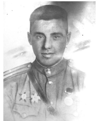
Второй подвиг моего прадеда

Видя свое неустойчивое положение, немецкое командование на участке Дворске Жахово Вельке (Польша) бросило в бой дивизию «Великая Германия». Это соединение, имевшее старшинство перед всеми другими воинскими частями Вермахта, вело свою историю от подразделения Берлинской гвардии. Наши части вели ожесточенный бой с вражескими войсками. Связь то и дело нарушалась от артиллерийского и минометного огня врага. Рискую жизнью, мой прадед лично выходил на устранение порывов линии связи, устранив только в один день 5 повреждений непосредственно под огнём противника.