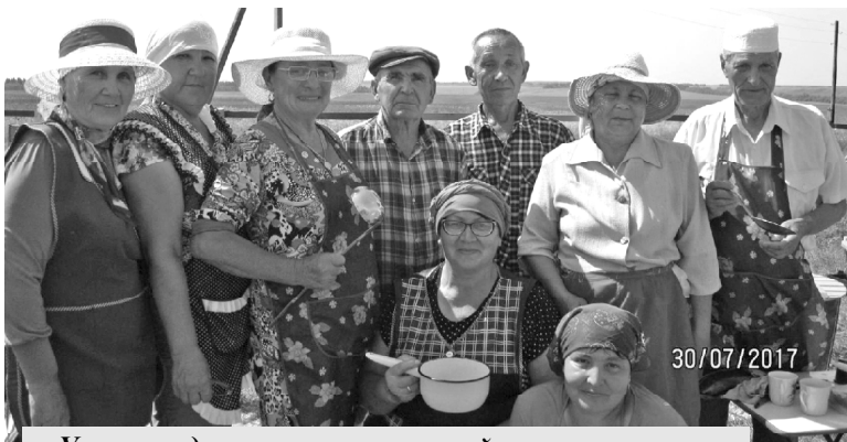
Угощения для участников и гостей готовили повара.