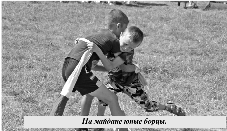
На майдане юные борцы.

Приветствовал жителей поселения и гостей праздника