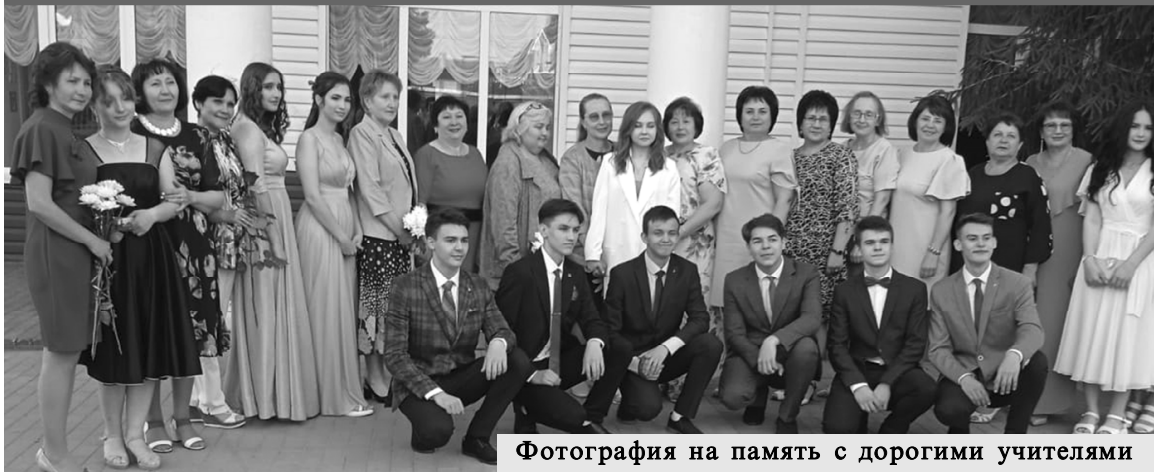
Фотография на память с дорогими учителями