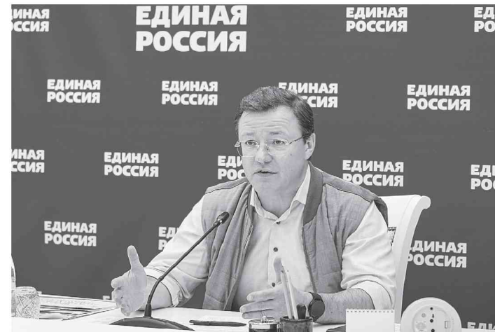
ДМИТРИЙ АЗАРОВ ВСТРЕТИЛСЯ С КООРДИНАТОРАМИ ПРОГРАММ «ЕДИНОЙ РОССИИ»