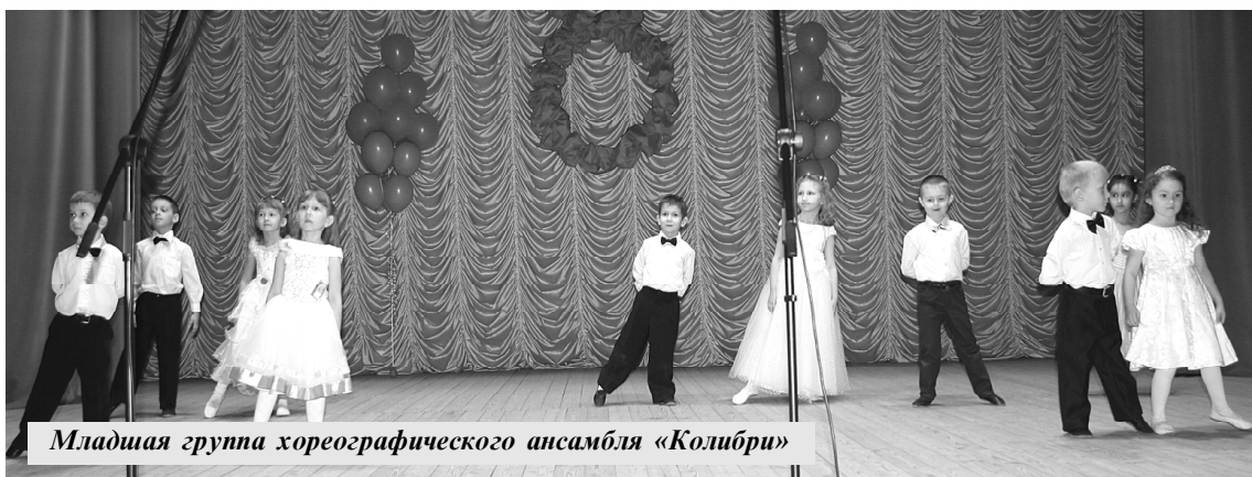
Младшая группа хореографического ансамбля «Коллибри»