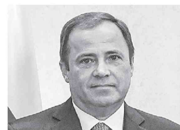
ИГОРЬ КОМАРОВ , полномочный представитель Президента в ПФО:

Творческими и культурными активностями, спортивными и интеллектуальными соревнованиями будет насыщена и культурно-досуговая часть форума: участники ждут фестиваль поколений, окружной DJ-фест, выставка арт-объектов «Дверь в регион».