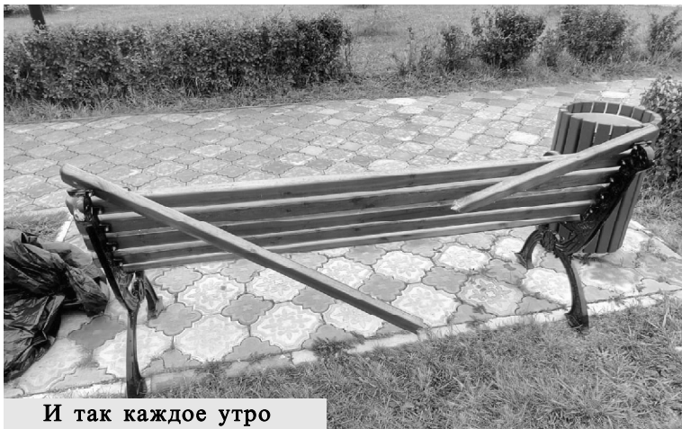
И так каждое утро