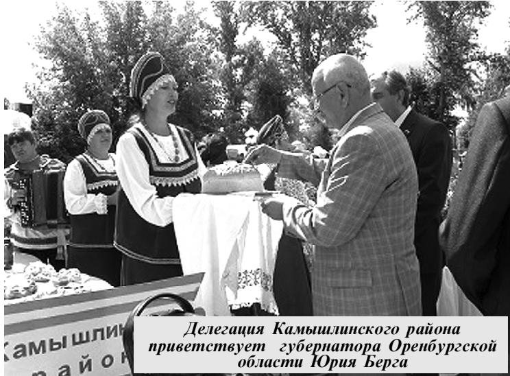
Делегация Камышлинского района приветствует губернатора Оренбургской области Юрия Берга

С самого утра здесь проходили праздничные народные гулянья, призванные привлечь внимание к здоровому образу жизни и чайным традициям разных народов. Программа фестиваля была разнообразна. Кроме непосредственно чаепития со сладостями