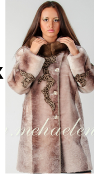
Реклама. ИНН 631901575308.

Размеры от 42 до 66. Рассрочка! При себе иметь паспорт.