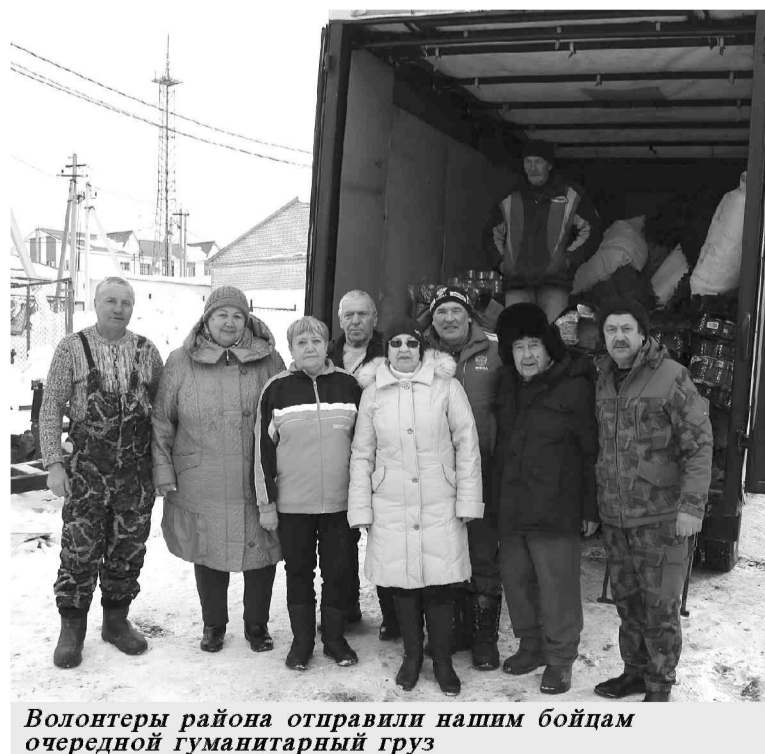
Волонтеры района отправили нашим бойцам очередной гуманитарный груз

Радует, что среди сельчан много добрых, сострадательных людей. А эти удивительные женщины-пенсионерки, пополняя ряды волонтерского движения, сплотили вокруг себя таких же единомышленниц, считающих своим долгом поддерживать бойцов в это трудное время, и бескорыстно делают большое благородное дело ради общей победы.