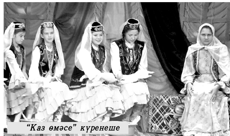
“Каз өмәсе” күренеше

Концерт программасы Балыклы мәктәбе укучылары чыгышы белән башланып китте. Аларның сәнгатьле итеп шигырь укуллары, дәртле жырлары тамашачылар күңеленә хуш килде, чыгышлары кайнар алкышларга күмелде. Балаларга чын күңелдән рәхмәт әйтеп, яхшы укуларын, ә укытучыларына эшләрендә уңышлар телибез.