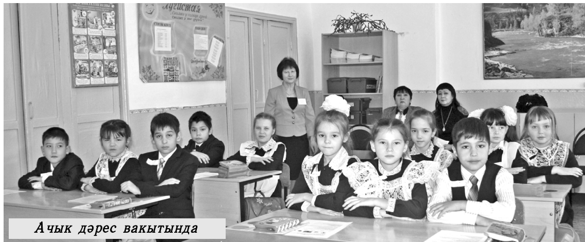
Ачык дәрес вакытында

аерым хөрмәт һәм рәхмәт сүзе белдерәсе килә. Бу чара бик тә оешкан төстә уздырылды. Бәйгеләрдә катнашучыларны, жюри әгъзаларын тәмле ризыклар, кайнар чәй белән сыйлау дисеңме, каршы алу, озату бик тә жылы төстә үтте. Әйткәнемчә, бәйге барышында "Татар халык ашлары" һәм "Кул эшләре" күргәзмәләре эшләр, алар белән якыннан танышырга мөмкин иде. Очрашу вакытында Иске Ярмәк гомуми белем бирү мәктәбеннән талантлы укучылары куннакларга эчтәлекле концерт программасы күрсәттеләр, ә экскурсовод мәктәп музейе белән таныштырды.