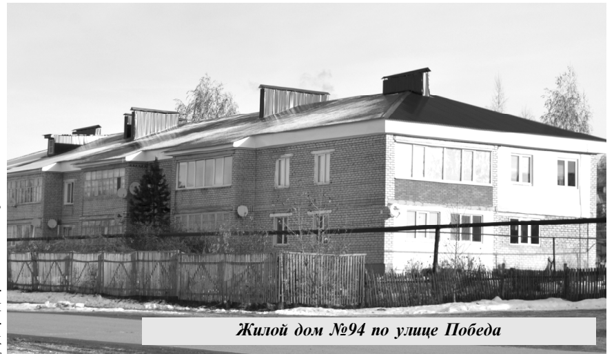
Жилой дом №94 по улице Победа

На территории Самарской области региональная программа капитального ремонта общего имущества многоквартирных домов успешно реализуется с сентября 2014 года. Мероприятия программы проводит созданная правительством региона