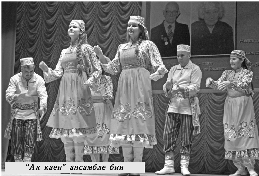
"Ак каен" ансамбле бии

Бу истәлекле вакийга бер язмага гына сыешлы түгел инде, хөрмәтле укучым. Газетабызның алдагы саннарында язмамның давамы булып, Аллаһы теләсә.