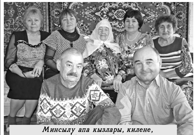
Минсылу апа кызлары, килене, улы һәм кияве арасында.