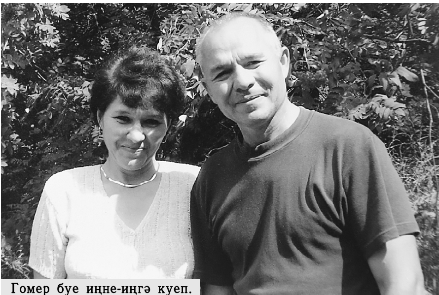
Гомер буге иңне-иңгә куеп.

Мәктәп еллары сизелми дә үтеп китә. Соңгы кыңгырау чыңнары да, чыгарылыш кичә-