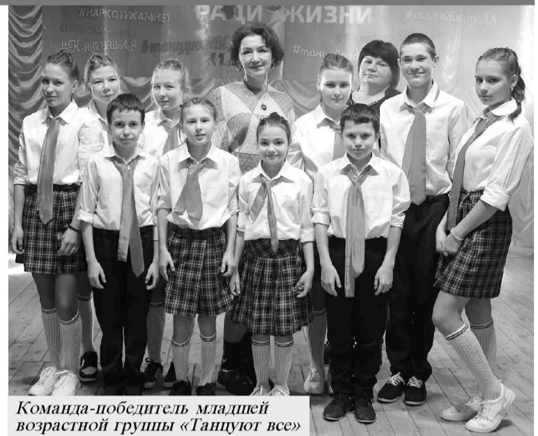
Команда-победитель младшей возрастной группы «Танцуют все»